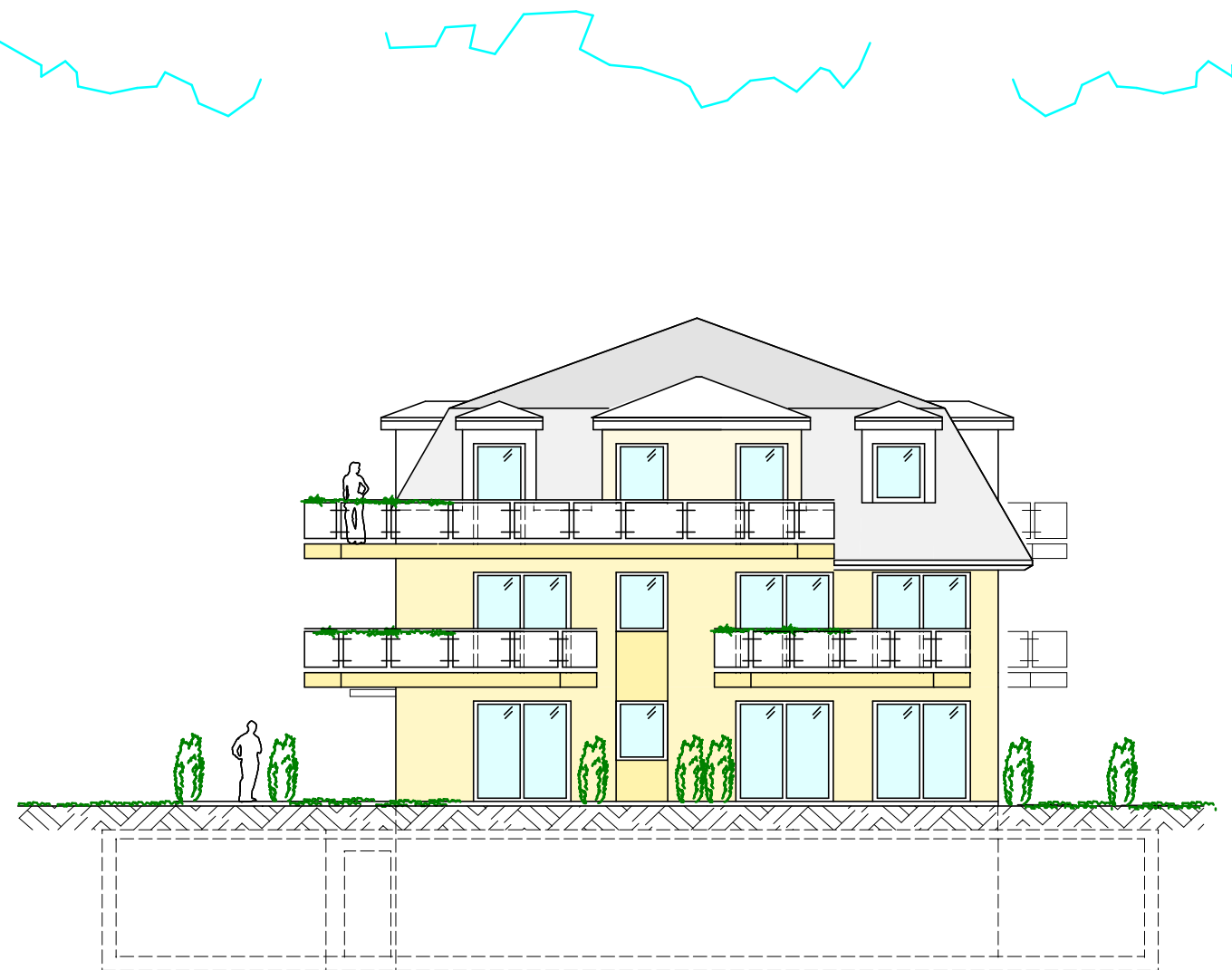
ANSICHT SÜDWEST HAUS 2