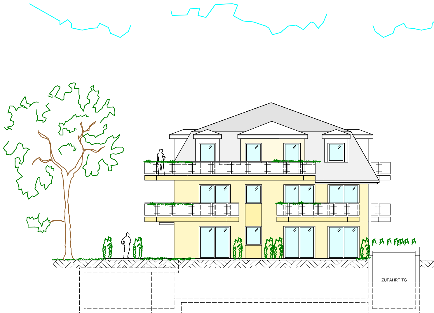
ANSICHT SÜDWEST HAUS 1